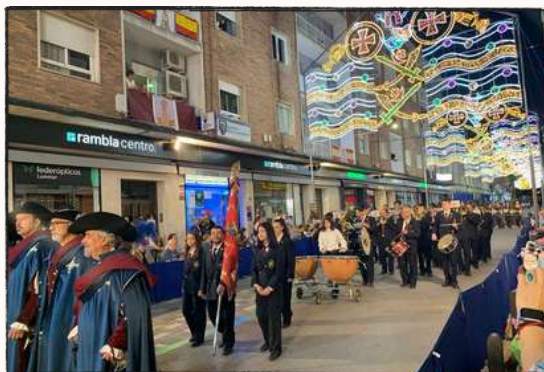
Con la comparsa “Mosqueteros” en Almansa

En julio realizamos un intercambio de bandas con la banda de la Asociación Musical “La Lira” de Cheste (Valencia). Celebramos el tradicional concierto organizado por la Hermandad de San Roque además de otro intercambio de bandas con la Agrupación Musical “La Primitiva” de Pozo Cañada, en esta ocasión en la localidad de la mencionada banda.