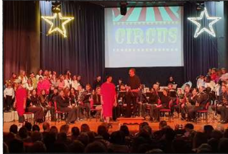
Concierto de Navidad "Vivan los Payasos"

En esta temporada, el concierto de Navidad se trasladó de fecha a después de Reyes que, a su vez, también se tuvo que aplazar finalmente al 14 de enero del presente año por problemas de salud de uno de los cantantes del espectáculo Vivan los payasos , de la productora Infinity.