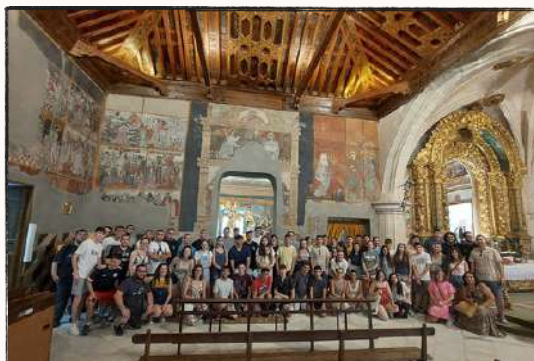
Festival de Bandas de Tobarra 2023