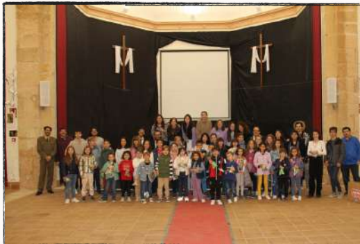
Gymkhana Santa Cecilia 2022