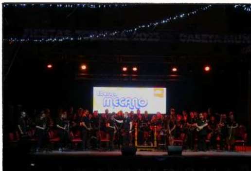
Concierto de fiestas "Eterno Mecano"