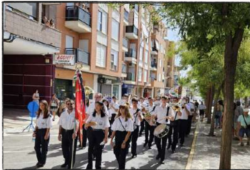
Procesión de San Roque