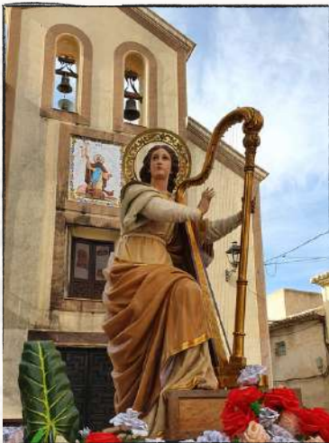
Procesión Santa Cecilia 2022

Todo comienza en las pasadas fiestas de Santa Cecilia del año 2022. Durante las mismas tuvimos un taller de estimulación musical para bebés y una gymkhana especial "Santa Cecilia" el sábado 5 de noviembre. El sábado siguiente tuvo lugar el pasacalles de nuestra banda de la escuela de música "Eduardo Sanchís Morell" y la comida, juegos y actividades para nuestros alumnos. El domingo celebramos el emotivo pasacalle de recogida e incorporación de nuevos músicos. El sábado 19 tuvo lugar el tradicional concierto que volvió a ser en la Casa de Cultura, ya que en 2020 no se pudo por las restricciones sanitarias y en 2021 se tuvo que emplazar en la plaza de toros, y la cena de hermandad. El martes 22 fue la misa en recuerdo a los músicos y socios fallecidos. El sábado 26 pusimos nuestro granito de arena ayudando a pintar el espacio que teníamos reservado de las escaleras de la cuesta de la Encarnación y también se realizó el IV campeonato de pádel. Para terminar nuestras fiestas el domingo celebramos la misa y procesión en honor a nuestra patrona.