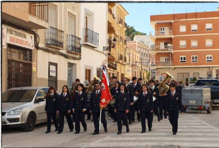
Recogida de nuevos músicos 2022