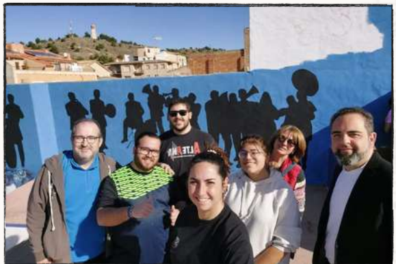
Pintando nuestro espacio en las escaleras de la Encarnación