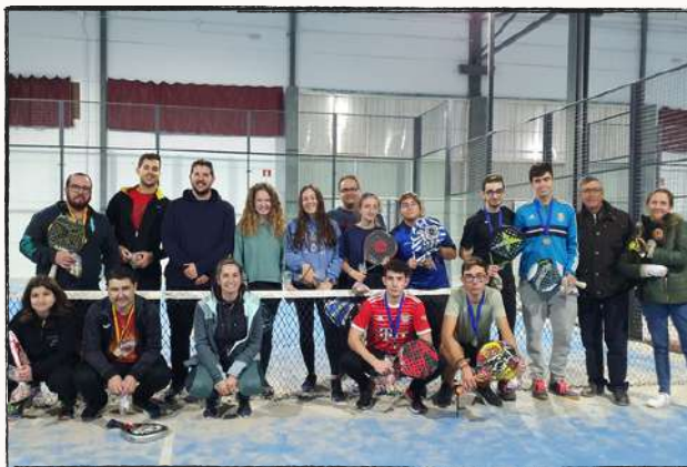
Pádel Santa Cecilia 2022