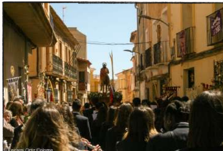
Domingo de Ramos 2023

A partir de esta fecha, como es costumbre, nos volvimos a meter de lleno con la preparación del concierto y procesiones de Semana Santa. El concierto tuvo lugar el día 5 de marzo en la Casa de Cultura, con motivo del 40 aniversario del Estatuto Autonomía de Castilla-La Mancha. Ya inmersos en Semana Santa, actuamos en el pregón de nuestra Semana Santa, Domingo de Ramos acompañando a "La Burrica", Lunes Santo en la procesión del Recuerdo, Miércoles Santo desfilando con el grupo escultórico de Jesús de la Salud, Jueves Santo con la Hermandad de la Caída de Jesús, Viernes Santo en la mañana con la Hermandad de Nuestro Padre Jesús, en la noche de nuevo con la Hermandad de la Santa Cruz, y Domingo de Resurrección con la imagen del Cristo Resucitado.